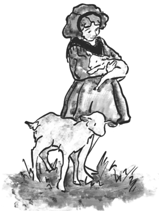
ilustracije in oblikovanje Gaja Bumbar www.bumbar.art

Pri navedbi posameznih podatkov lahko pride do napake, zato se prosim posvetujete z osebjem.